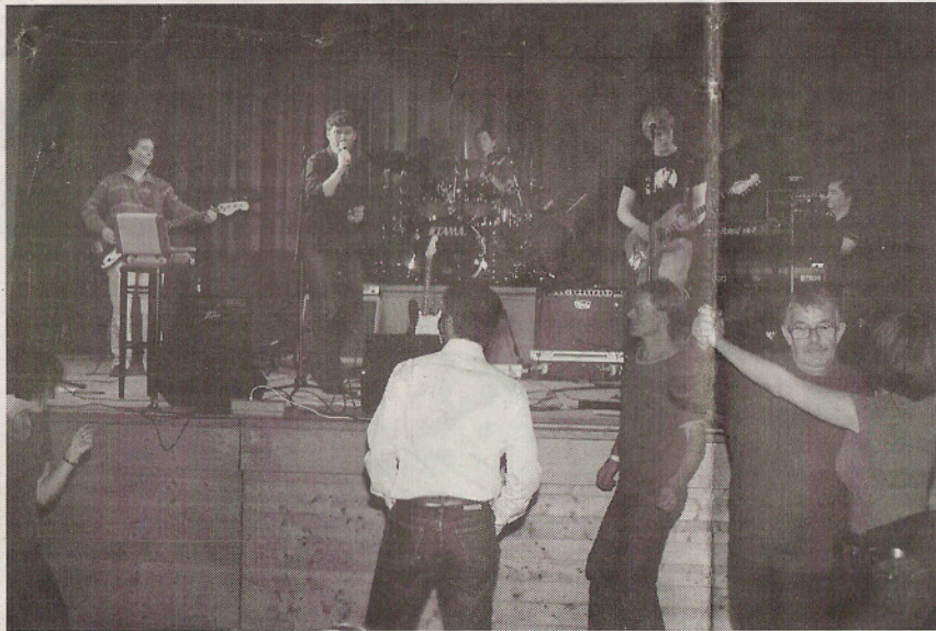
Walt's Blues Box voll in Fahrt